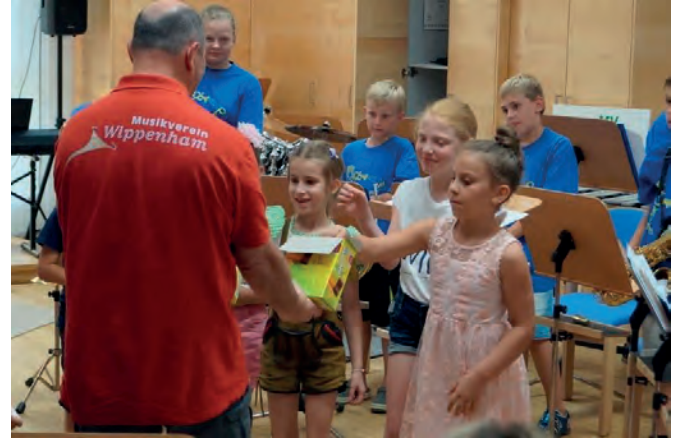
Für die ganzen Mühen gabs dann schlussendlich auch eine kleine Belohnung.